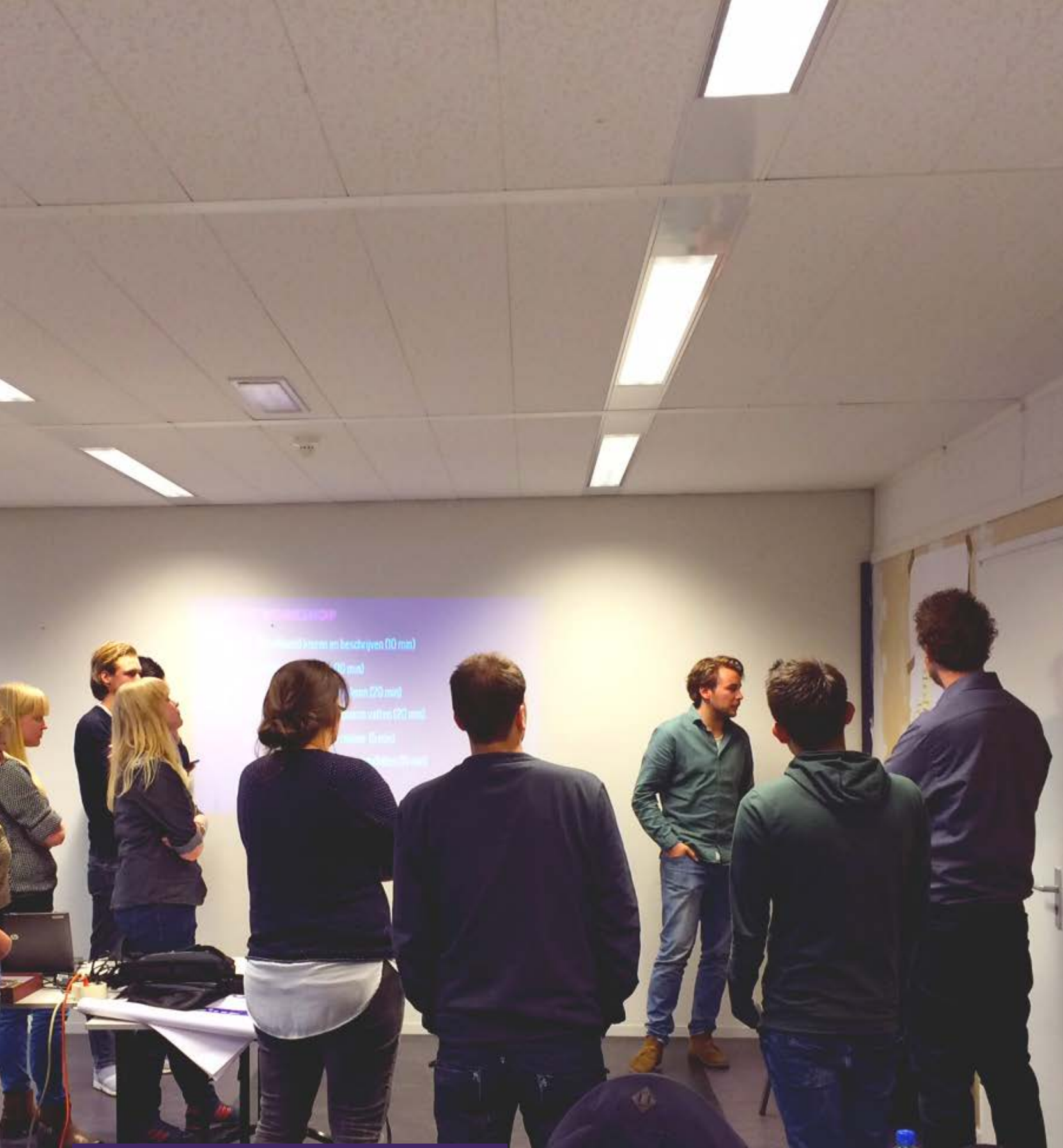
Afbeelding 4: Workshop bewonersparticipatie in gebiedsontwikkeling, Winterschool Radboud Universiteit Nijmegen.