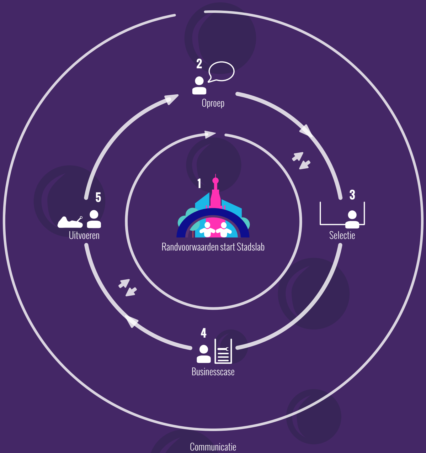
Afbeelding 5: Eerste opzet Stadslab methodiek.