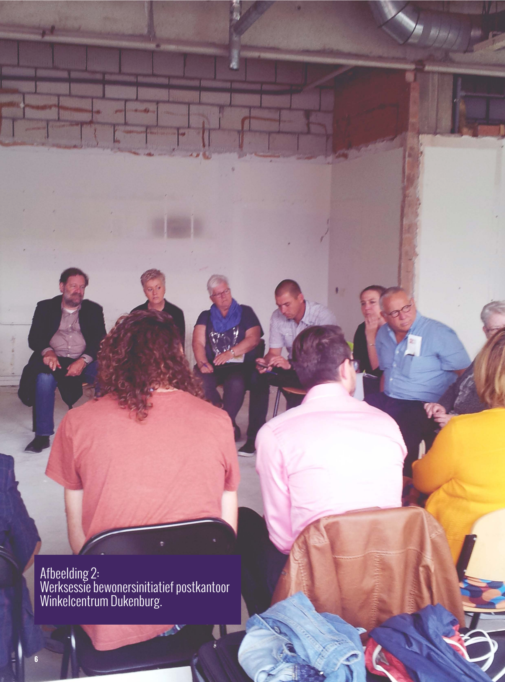
Afbeelding 2: Werksessie bewonersinitiatief postkantoor Winkelcentrum Dukenburg.