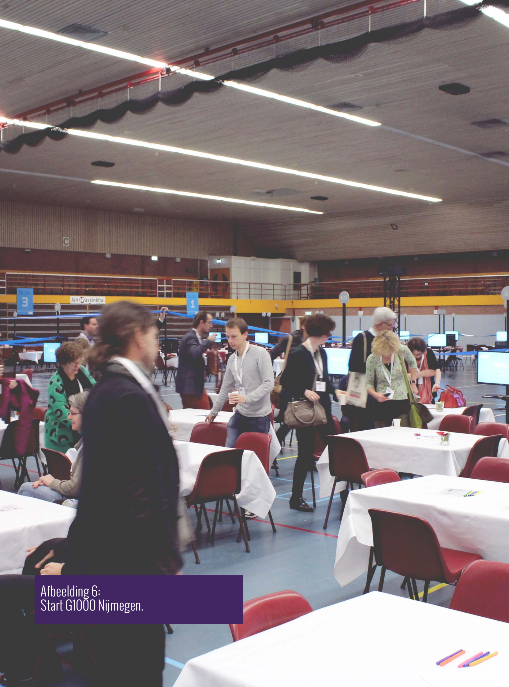
Afbeelding 6: Start G1000 Nijmegen.