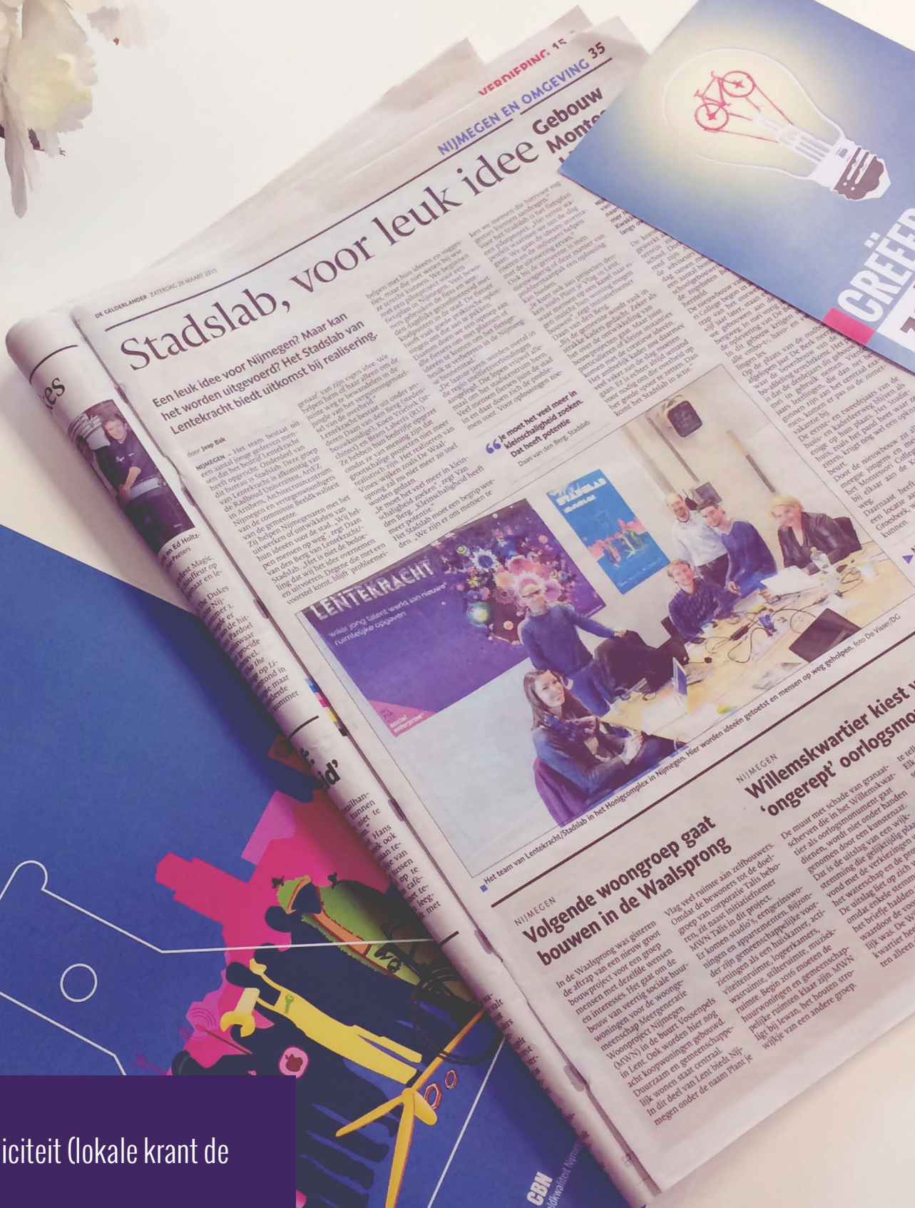
Afbeelding 3: Promotie en publiciteit (lokale krant de Gelderlander).