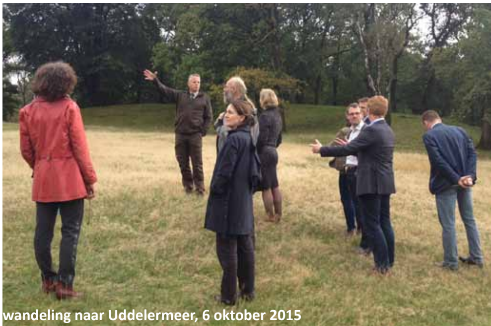
wandeling naar Uddelermeer, 6 oktober 2015

Zijaanzicht heeft een uitgebreide inventarisatie gedaan en alle plannen en onderzoeken op een rij gezet. Vervolgens zijn er gesprekken geweest met alle betrokken partijen. Met hen is gesproken over de huidige toestand van het meer en het toekomstperspectief. Omdat bleek dat bij alle partijen ongenoegen leefde over de status quo maar niemand de verantwoordelijkheid wilde of kon nemen, heeft Zijaanzicht met alle betrokkenen een werkbijeenkomst georganiseerd over de toekomst van het Uddelermeer. De