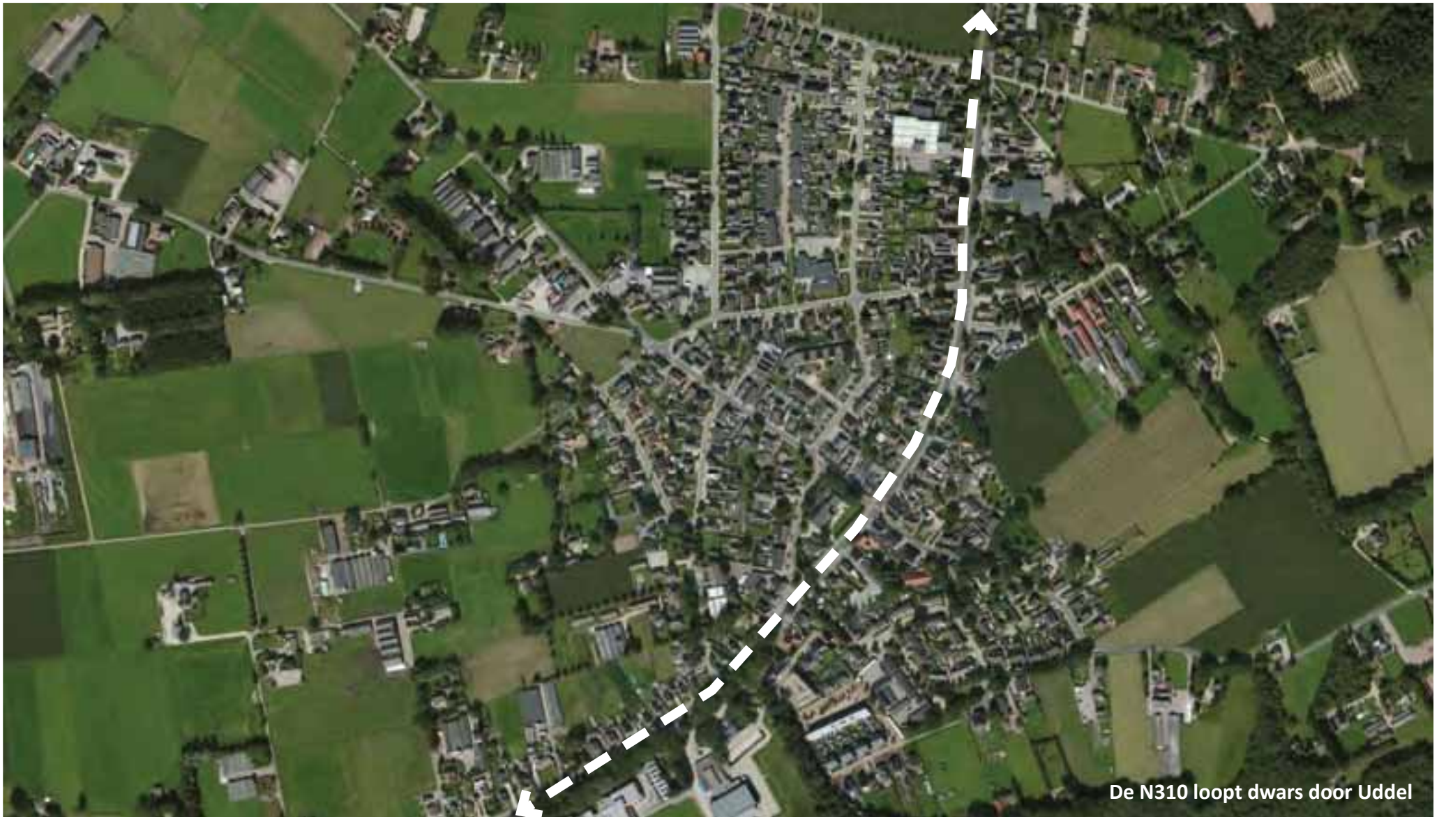
De N310 loopt dwars door Uddel