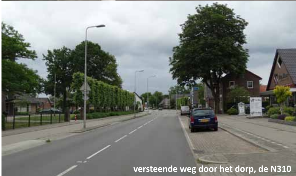
versteende weg door het dorp, de N310