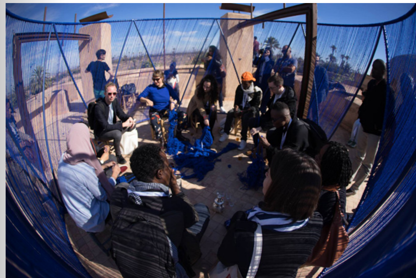
↑ Installatie Stargaze van het project El Labana Gardens in Cairo, Egypte, tijdens African Crossroads in Marokko

Het fonds scherpert de strategische communicatie aan binnen dit programma, om de kernboodschappen effectief te kunnen communiceren met onze doelgroepen (het ontwerpveld en aanverwante velden in Nederland en in de vier landen, de opdrachtgevers en projectpartners en een breder cultureel publiek). De communicatie met en over de focuslanden Turkije, Rusland, Egypte en Marokko vraagt om een politiek en cultureel sensitieve aanpak. Het fonds zoekt daarom een externe communicatiestrategie om een communicatiestrategie te ontwikkelen en uit te voeren. Het plan bouwt strategisch op naar december 2020. Het communicatieplan zal daarbinnen een link leggen met het impact framework en het belang van 'joint-learning'. In 2018 is de opdracht hiervoor verkend en geformuleerd onder begeleiding van Rachida Abdellaoui, communicatiestrategie en oprichter van Whisper.