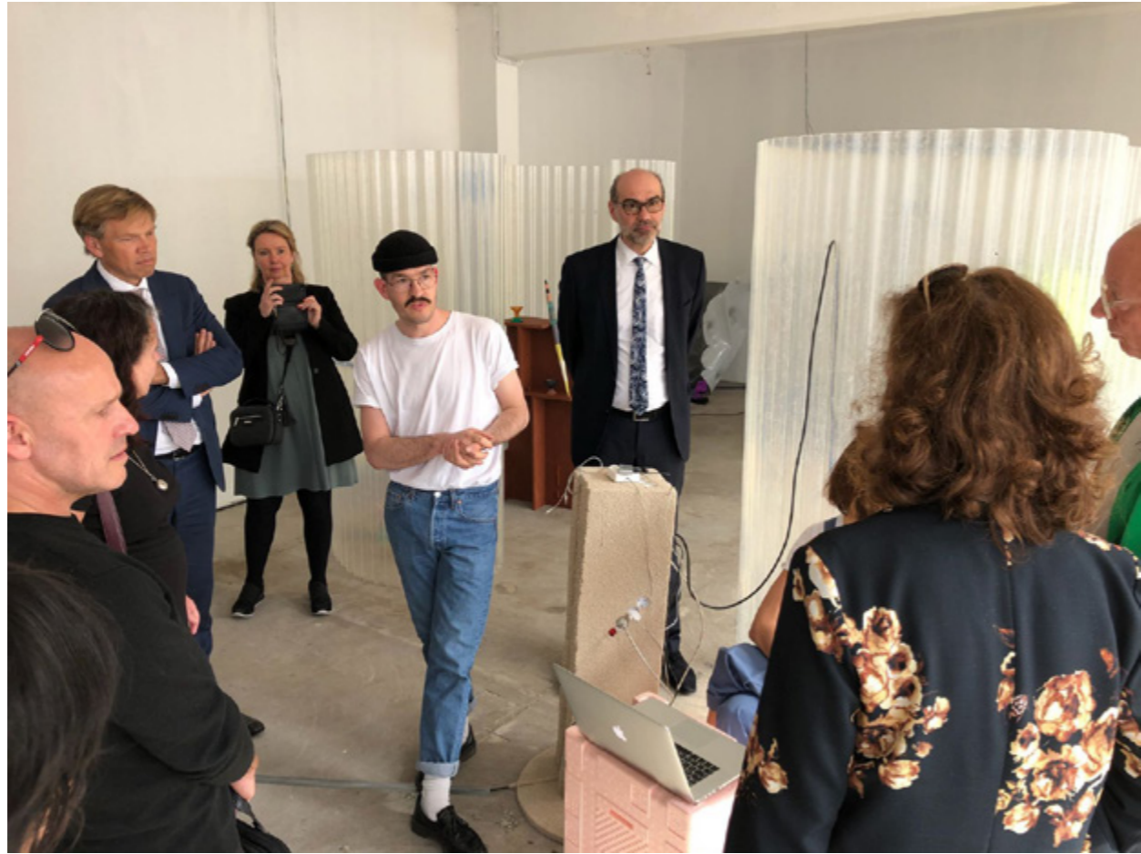
Ready, Set, Go!, Better Known As op de Salone del Mobile 2018 ↑