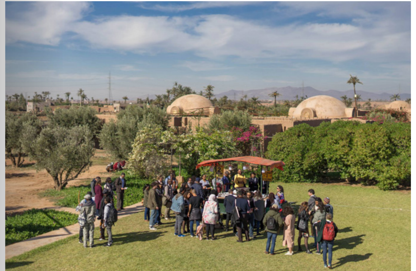
↑ Food For Thought installatie van het project PLAY CITY