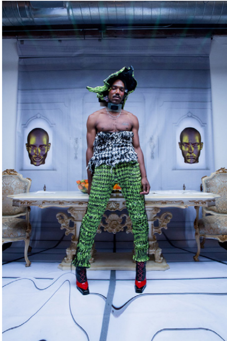
Fauxlywood, Maison the Faux tijdens de Los Angeles Fashion Week ↑