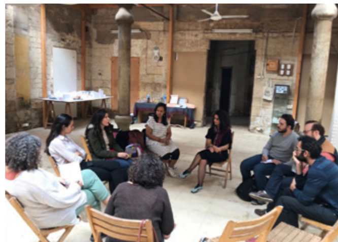
Oriëntatieris Caïro ↑

Het programma omvat open oproepen en initiërende, ondersteunende flankerende activiteiten, waaronder inspirerende en informerende meet-ups, teambijeenkomsten, inloopspreekuren en aanvullende opdrachten. De opzet is ontwikkeld op basis van gesprekken met stakeholders, een oriëntatieris naar de vier landen en feedback van ontwerpers en experts in het veld. Door de programmatische opzet is er ruimte en flexibiliteit om tijdens het programma doeltreffende aanpassingen te verrichten. Naast de ontwikkeling van een impact framework is ook een start gemaakt met het ontwikkelen van een passende communicatiestrategie.