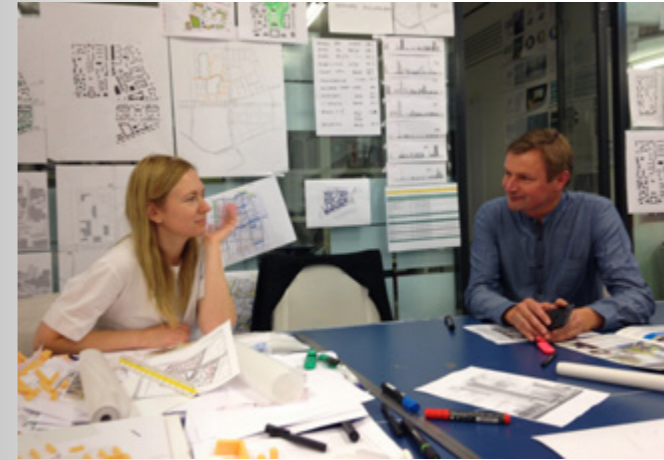
↑ Oriëntatieris Moskou

Het eerste jaar (2017) stond in het teken van het inventariseren van de vraag. De vier focuslanden zijn divers wat betreft hun culturele landschap en de bekendheid ervan bij Nederlandse ontwerpers en makers. In de beleidsperiode 2013 - 2016 zijn er weinig aanvragen ingediend en gehonoreerd die plaatsvinden in deze vier focuslanden. Hoewel er enkele projecten waren ondersteund in deze landen, was er nog weinig zicht op de voorwaarden voor een geslaagd project. Bovendien verschillen de landen van elkaar wat betreft politieke stabiliteit, de ontwikkeling van het maatschappelijk middenveld, het naleven van mensenrechten en veiligheid.