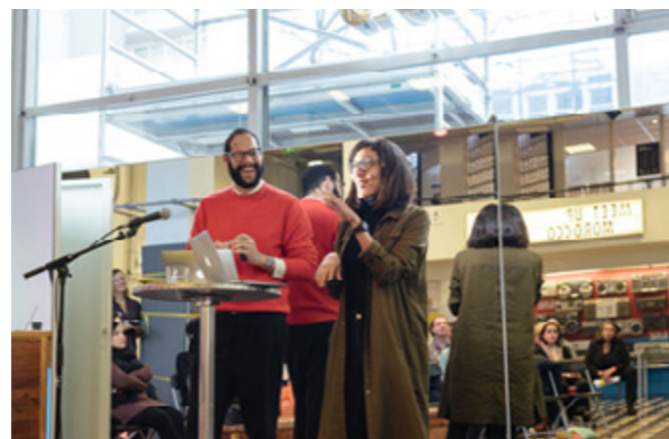
↑ Serie van vier meet-ups gericht op netwerk- en kennisuitwisseling Open Oproep TREM #1, februari 2018