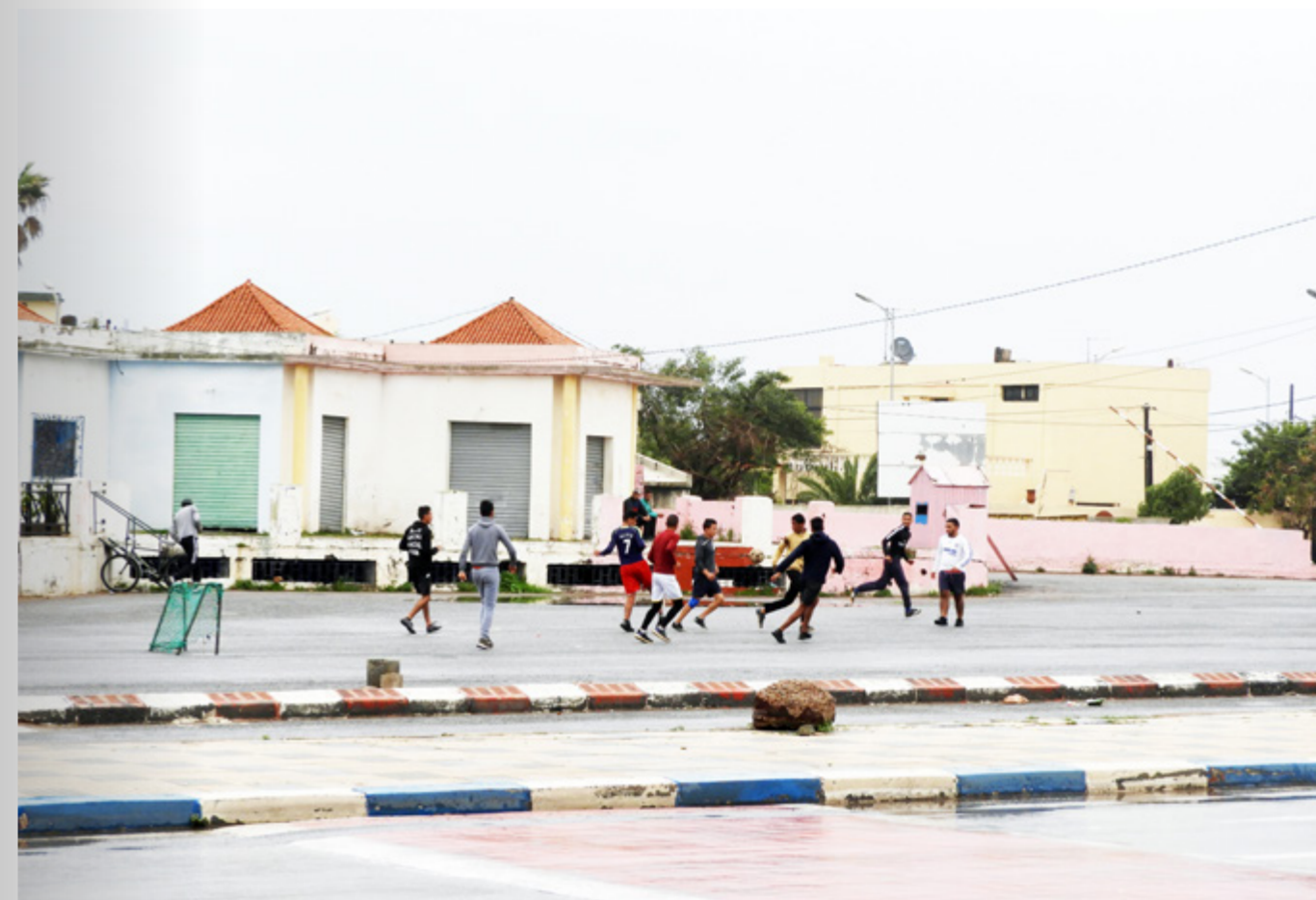
↑ PLAY CITY in Rabat, Network of Research & Architecture BV