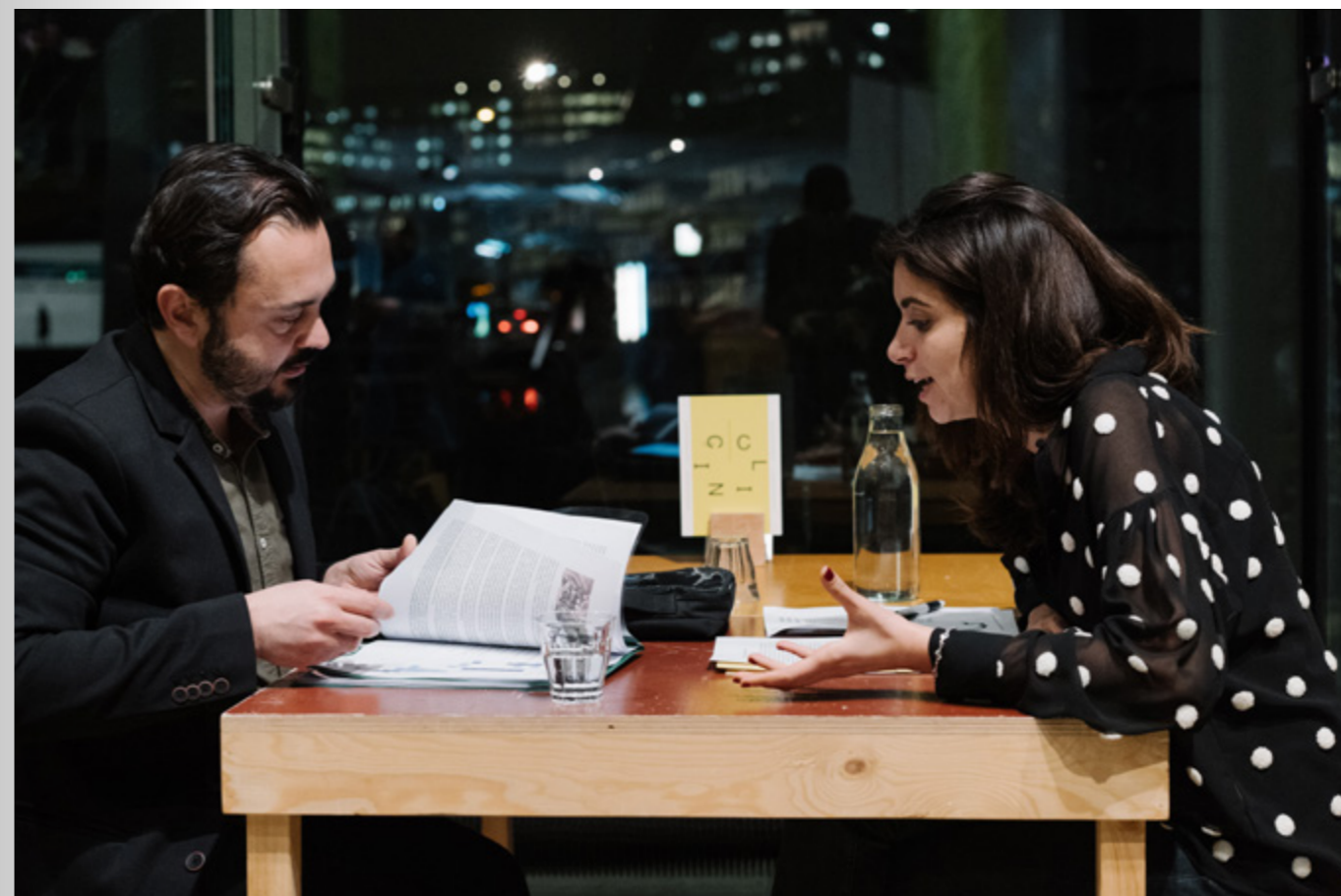
1 Inloopspreekuur Open Oproep TREM #2

Het fonds streeft naar een terugkoppeling naar alle posten die advies hebben geleverd, ook als een aanvraag is afgewezen. In de beschikking van gehonoreerde projecten vragen wij de aanvragers het postennetwerk in het betreffende land uit te nodigen bij eventuele activiteiten.