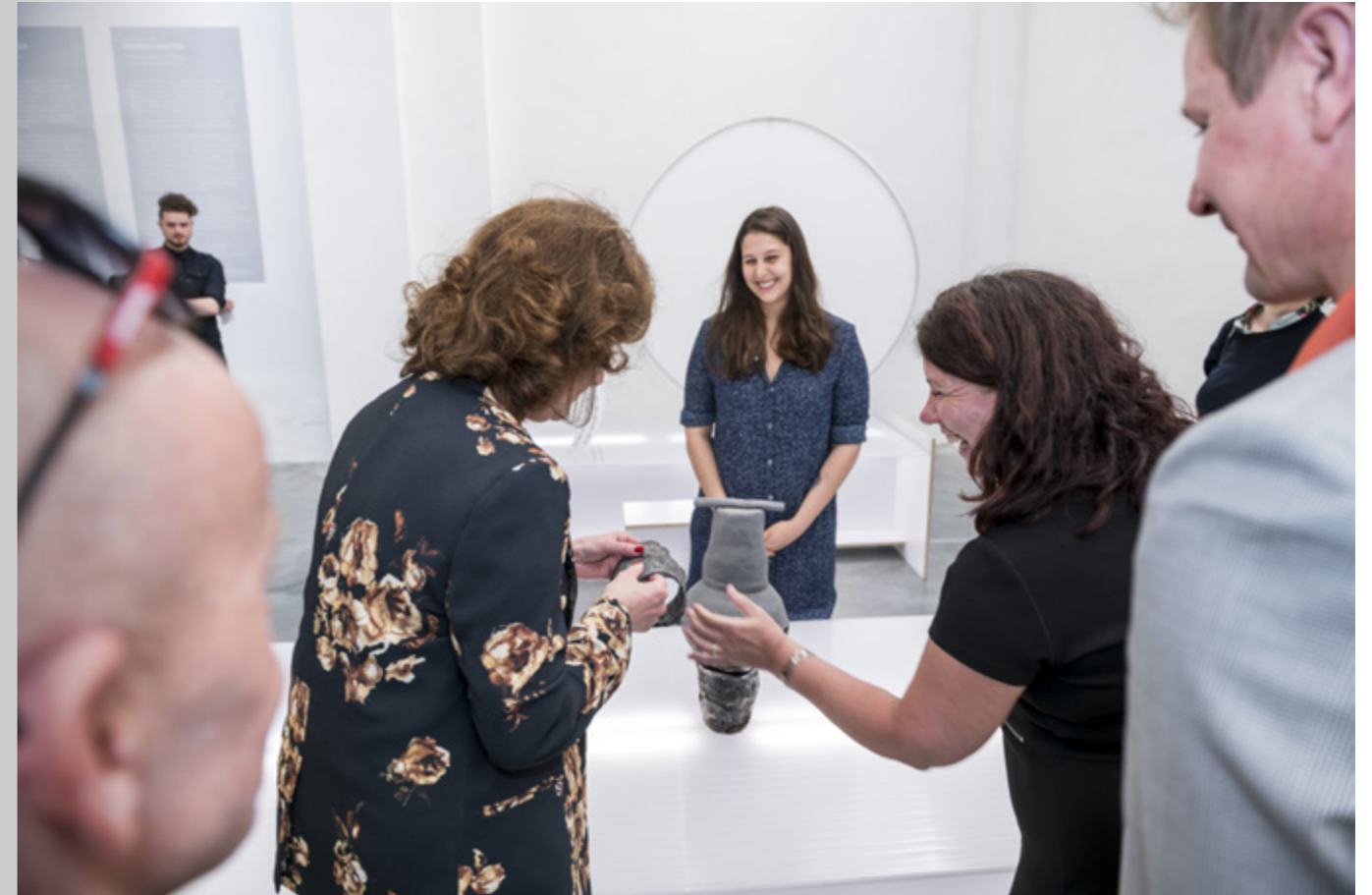
↑ Metamorphism: Yulem, Shahr Livne op de Salone del Mobile 2018