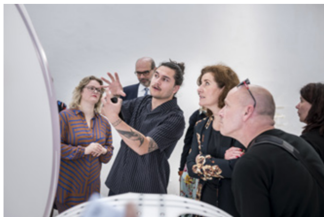
1 Mutant Matter, Dutch Invertuals en ZwartFrame op de Salone del Mobile 2018

Het fonds ondersteunt ook projecten in de focus- en maatwerklanden vanuit het flankerend beleid van het Programma Internationalisering Ontwerpsector en tevens vanuit de basisregelingen die onderdeel uitmaken van de instellingssubsidie. In 2018 is besloten om een bedrag van € 70.000 uit het budget van de subsidieregeling Internationalisering over te hevelen naar het flankerend budget, zodat het fonds actiever en gericht kan inspelen op actuele vragen en ondersteuningsbehoeftes die door urgentie of vorm niet goed aansluiten bij de Deelregeling Internationalisering. Hierover is goed contact met de posten. In 2018 zijn uit die flankerende middelen de volgende activiteiten gefinancierd: Gamescom in Duitsland, London Fashion Showcase, het Dutch Stuff Pavilion in het Verenigd Koninkrijk en deelname aan SXSW 2019.