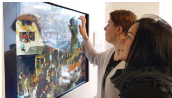
↑New Urban Media Centre in Yekaterinburg, SVESMI HOLDING BV

In anderhalf jaar tijd is het Stimuleringsfonds erin geslaagd een methodiek te ontwikkelen waarin het (ontwerp)veld zowel in Nederland als in de vier landen is geactiveerd. Er zijn nieuwe netwerken opgebouwd, bestaande zijn verstevigd en er is bovendien een impact framework ontwikkeld.