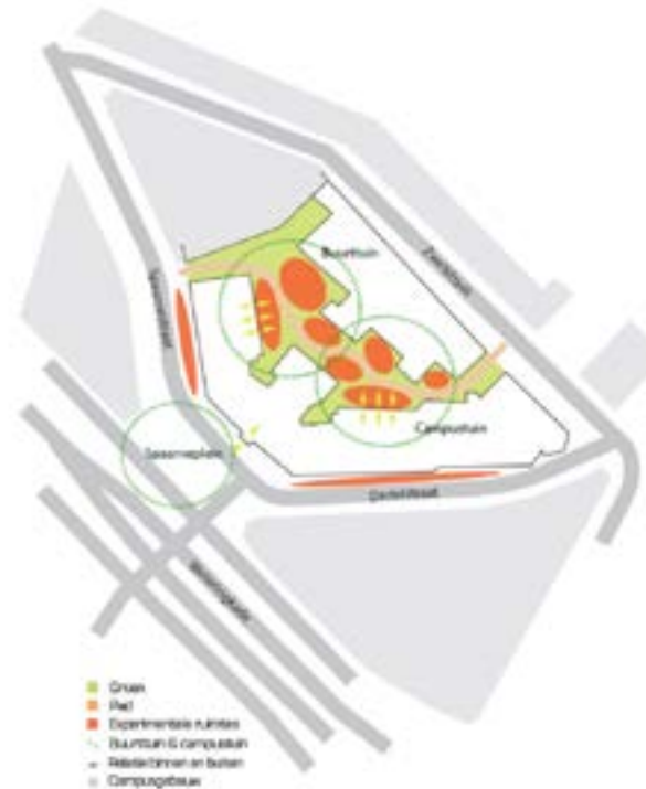
Mogelijk concept voor binnentuin NWC door Groene Helden