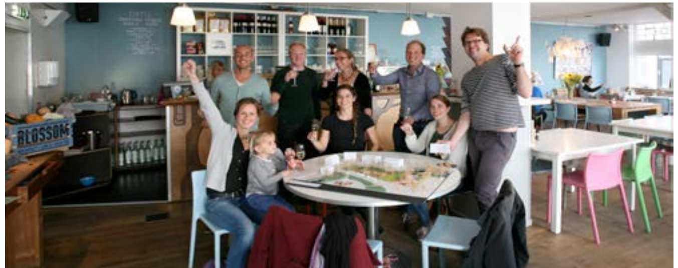
Team Blossom in the Park