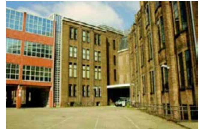
Toekomstige binnentuin New World Campus