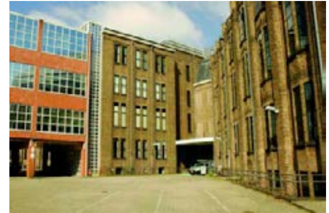
Toekomstige binnentuin New World Campus