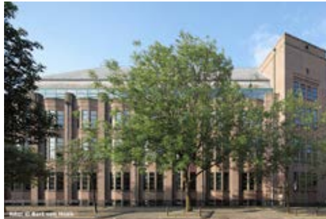
Voorzijde New World Campus

De Groene Helden hebben voor het binnenterrein, nu nog een parkeerplaats, advies gegeven voor de ontwikkeling van deze versteende plek tot een duurzame groene omgeving. De binnentuin gaat plaats bieden aan groene, innovatieve initiatieven die ook economisch rendabel kunnen zijn, aan groene netwerkruimtes en aan buurtinitiatieven om omwonenden te betrekken bij de ontwikkeling van de tuin. Momenteel zijn we nog in onderhandeling over een mogelijke samenwerking in de toekomst.