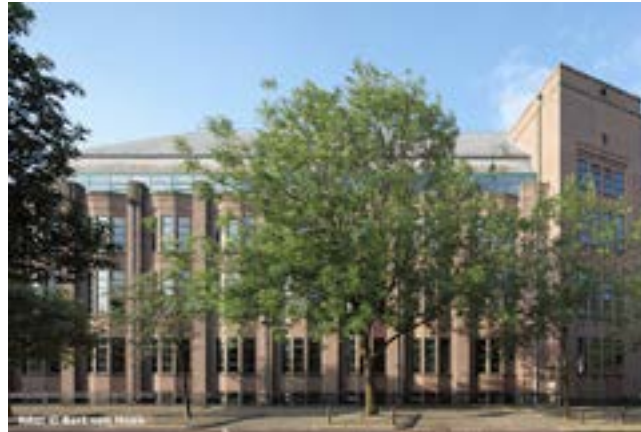
Voorzijde New World Campus

De Groene Helden hebben voor het binnenterrein, nu nog een parkeerplaats, advies gegeven voor de ontwikkeling van deze versteende plek tot een duurzame groene omgeving. De binnentuin gaat plaats bieden aan groene, innovatieve initiatieven die ook economisch rendabel kunnen zijn, aan groene netwerkruimtes en aan buurtinitiatieven om omwonenden te betrekken bij de ontwikkeling van de tuin. Momenteel zijn we nog in onderhandeling over een mogelijke samenwerking in de toekomst.