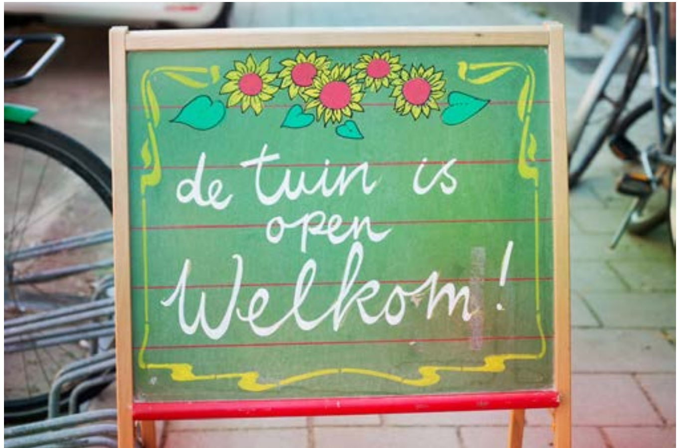
Welkomstbord buurttuin 'Het Welpje', Roggeveenstraat Den haag

Op de volgende pagina's worden deze workshops beschreven in woord en beeld.