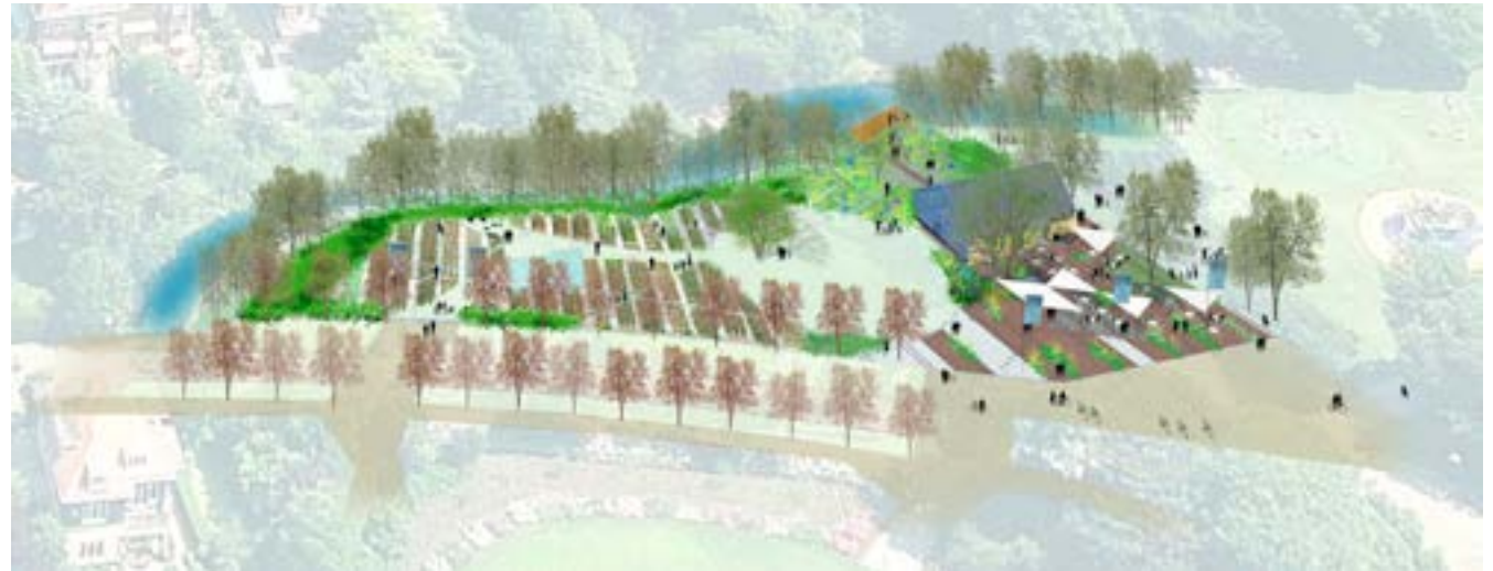
Vogelvluichtperspectief Blossom in the Park

Inmiddels wordt er hard gewerkt aan de verdere uitwerking van het plan zodat eind volgend jaar Blossom in the Park gerealiseerd kan worden.