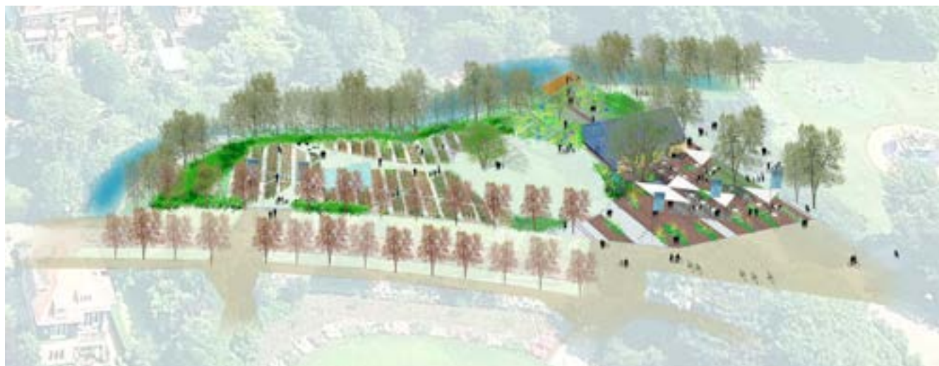
Vogelvluichtperspectief Blossom in the Park

Inmiddels wordt er hard gewerkt aan de verdere uitwerking van het plan zodat eind volgend jaar Blossom in the Park gerealiseerd kan worden.