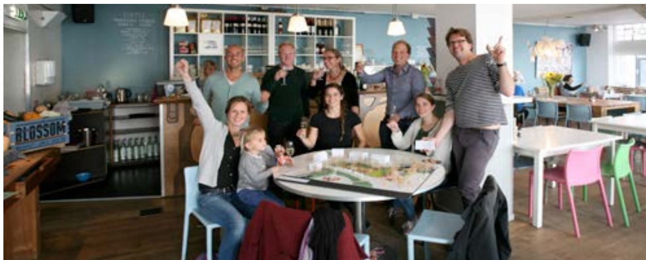
Team Blossom in the Park