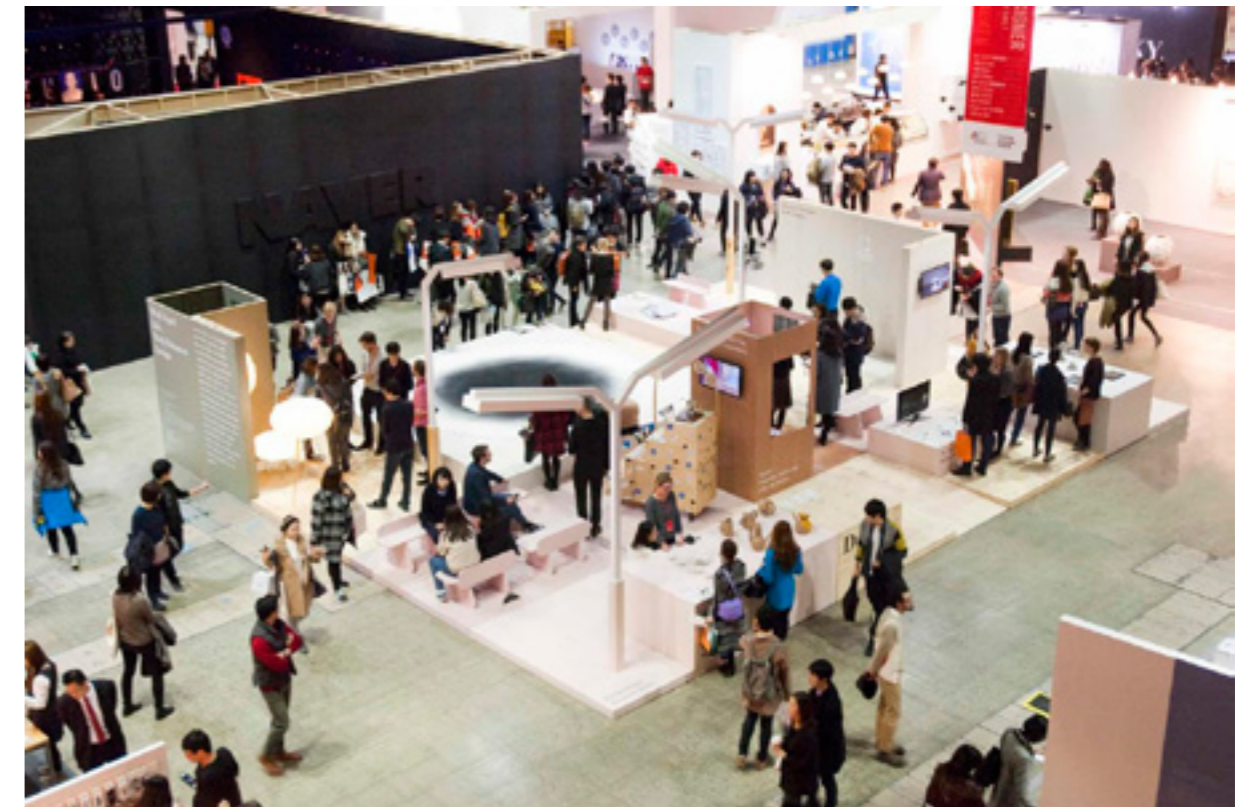
In 2014 ondersteunde het fonds tien ontwerpers voor deelname aan de Seoul Design Week, in het kader van het verkennen van nieuwe internationale presentatie mogelijkheden voor Nederlandse vormgeving.