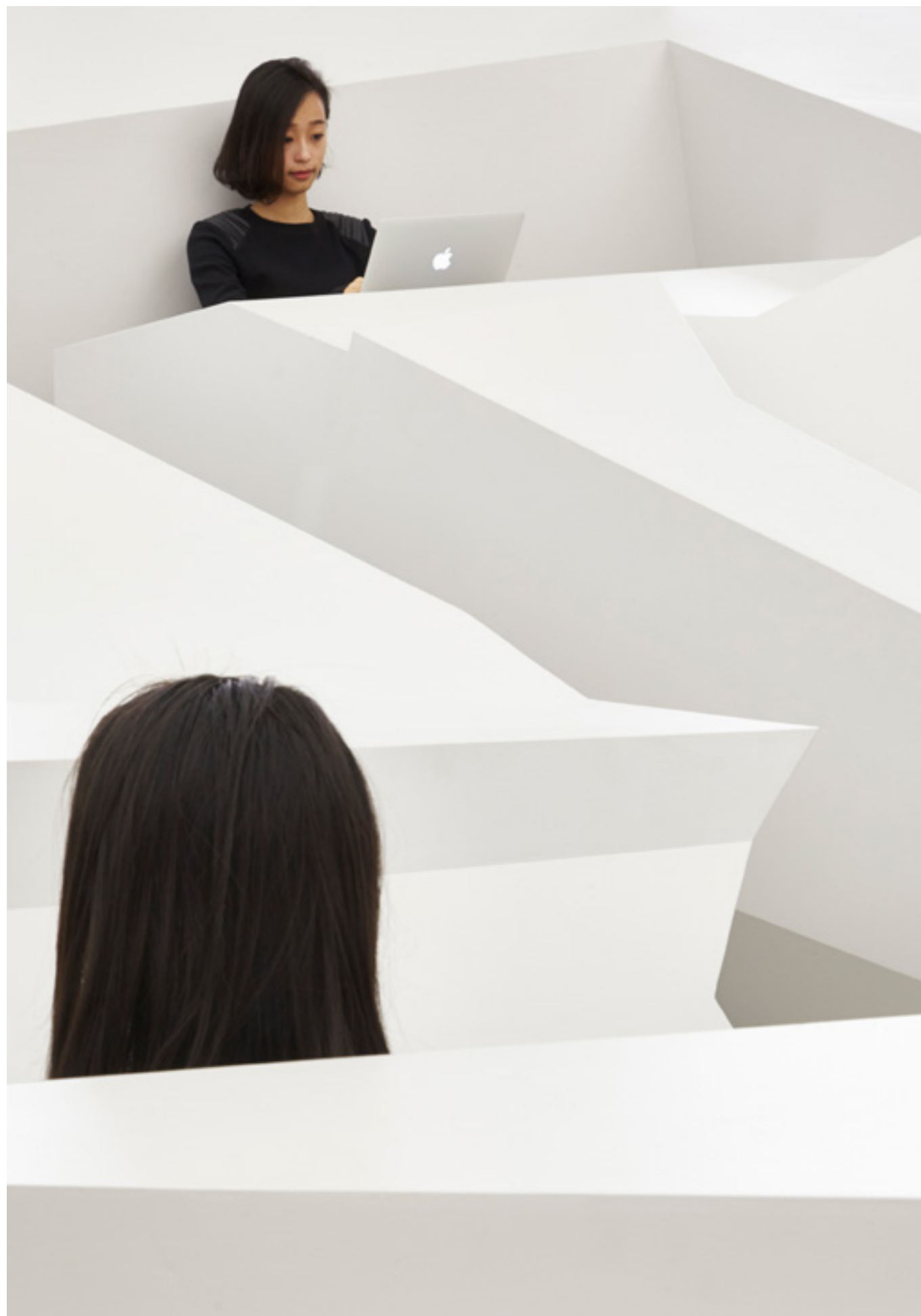
Het RAAAF-project The End of Sitting is een installatie die op een nieuwe manier kijkt naar de inrichting van de hedendaagse leefomgeving. De installatie werd verscheept naar de Chicago Architectuur Biënnale en kreeg veel aandacht in de internationale media, waaronder CNN, CBS-news en Chicago Tonight.