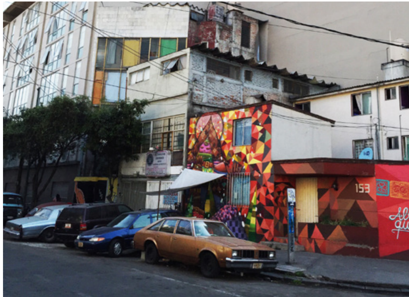
In het urban lab Mexico, een initiatief van het Stimuleringsfonds en UN-Habitat, werken vier Nederlandse ontwerpers met Mexicaanse partners o.a. aan een ecologisch verantwoorde en sociaal inclusieve verbetering van het woningaanbod voor mensen met lagere inkomens.