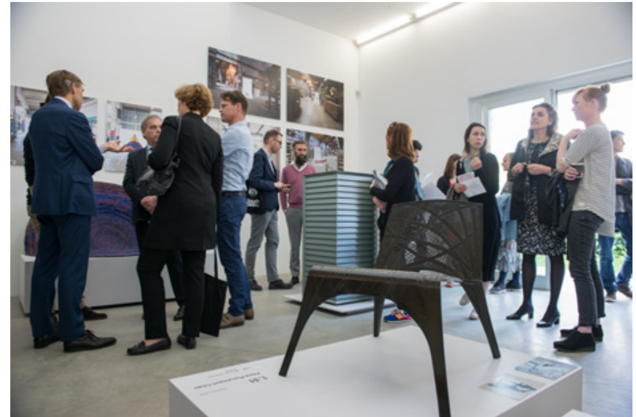
Rondleiding OCW delegatie en medewerkers ambassade Rome en consulaat Milaan langs door het Stimuleringsfonds ondersteunde presentaties op de Salone del Mobile 2016.