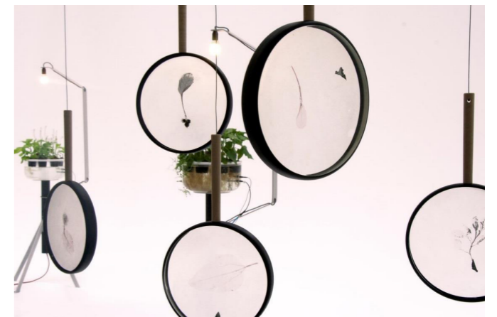
Geomerce tijdens Salone del Mobile 2015

Lichtontwerper Gionata Gatto (Italië, 1982) doet een ontwerpend onderzoek naar het gebruik van planten als sensor. Hiervoor werkt Gatto samen met het Laboratorio Internazionale di Neurobiologia Vegetale (LINV), een laboratorium dat onderzoek doet naar de elektrische signalen die planten voortbrengen als reactie op veranderingen in hun omgeving. Het project bevaagt de inzet van planten op het gebied van