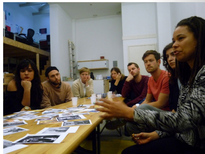
Bijeenkomst selectie 2013

In 2013 en 2014 was er elk jaar budget voor 30 beurzen van € 25.000. De beurs wordt verstrekt aan één individu of een studio (een of meerdere makers verenigd). Het bedrag is verdeeld in drie delen. Het grootste deel, € 15.000, is vrij te besteden en geeft makers de ruimte om eigen onderzoek te doen en nieuw werk te maken. Daarnaast is er een deel voor presentatie doeleinden en een deel voor kennisontwikkeling, elk € 5.000. Het deel voor kennisontwikkeling is bedoeld om kennis in te kopen op het gebied van de eigen discipline, maar ook op het gebied van cultureel ondernemerschap en praktijkontwikkeling. Dit kan in de vorm van het inhuren van een coach, het bezoeken van conferenties, het volgen van een cursus, zolang het maar het betrekken van kennis betreft bij de eigen professionele ontwikkeling.