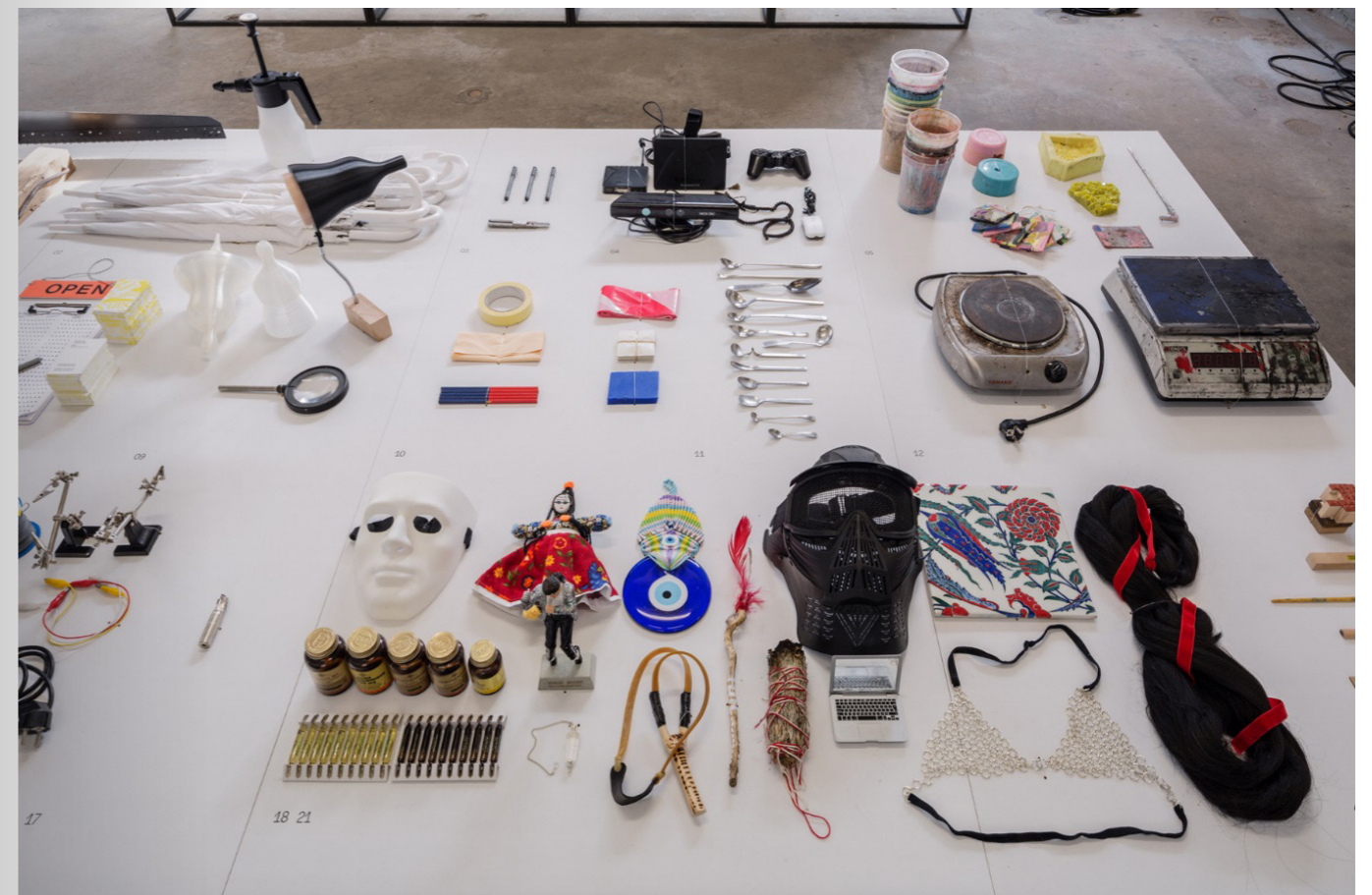
Designers' tools at In No Particular Order