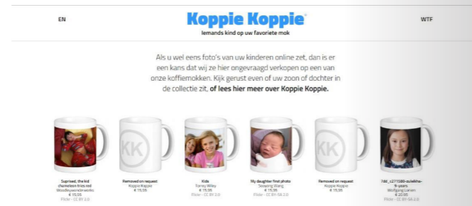
Koppie Koppie - door Yuri Veerman