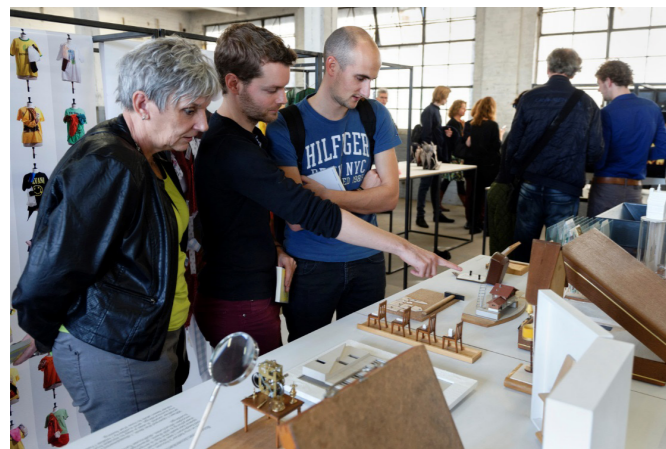
Publieke presentatie tijdens DDW 2014

Het subsidieprogramma ondersteunt jonge makers met bewezen talent uit de disciplines architectuur, vormgeving en e-cultuur met een werkbeurs, een op maat gemaakt programma en een publieke presentatie.