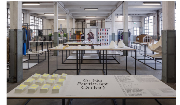
Tentoonstelling In No Particular Order

Tijdens de Dutch Design Week (18 t/m 26 oktober 2014) werden de nieuwste projecten van de lichting talentontwikkeling 2013-2014 in de Schellensfabriek in Eindhoven gepresenteerd.