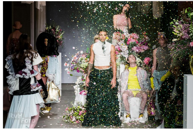
Maison the Faux